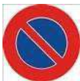
Interdiction de stationner Figure 2.50 de l'OSR