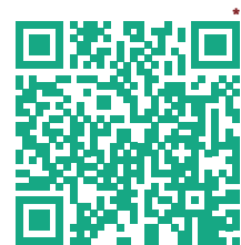
Chaîne WhatsApp «Commune de Montanaire»

Nous attirons votre attention sur le fait que les messages n'arriveront pas dans votre fil de discussion comme lorsque vous parlez à un ami mais bien dans l' onglet «Actus» 4 en bas de l'écran.