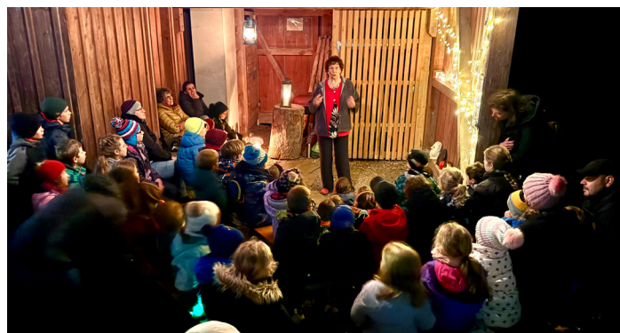
Au Bois des Brigands, plein d'oreilles attentives écoutent les Contes