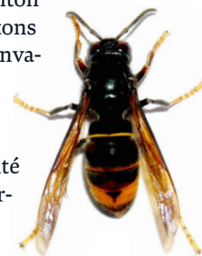
Frelon asiatique à l'échelle 1:1

MONTANAIRE : Le frelon asiatique se développe rapidement en Suisse, notamment dans le canton de Vaud, qui constitue, avec le canton de Genève, l'un des cantons les plus touchés par l'invasion de cette espèce. Il constitue une menace pour l'économie mellifère, pour la biodiversité et pour la santé, c'est pourquoi une lutte active est nécessaire.